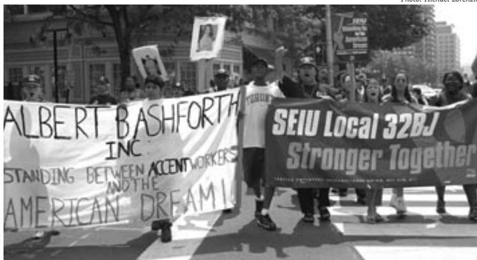
Amistades y miembros de la Local 32BJ continuarán la lucha contra las firmas administradoras de edificios que empleen contratistas de limpieza socialmente irresponsables.

Estamos escribiendo para expresar nuestra preocupación acerca del maltrato que recibimos de Albert B. Ashforth, Inc. la administradora de 12 East Ridge Properties en Westchester, en la que AEW maneja capitales. Vinimos a Stamford con cartas firmadas