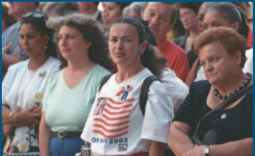
Local 32BJ friends and family gather to remember our 24 lost brothers and sisters. Familiares y amistades de la Local 32BJ se reúnen para conmemorar a nuestros 24 compañeros y compañeras que perecieron.

Lighting our way to the future. Iluminando nuestro camino al futuro.